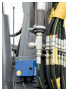
Gut geschützte Elektrikbox der Winde.