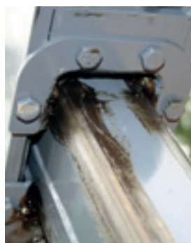
Die Gleithalter sind leicht zu montieren bzw. demontieren um ein leichtes Austauschen der Gleitplättchen zu ermöglichen.