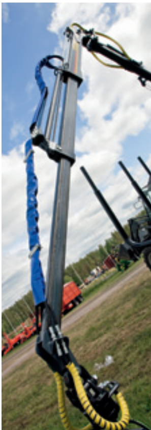
Der Teleskopzylinder und die Hydraulikschläuche sind sicher an der Oberseite des Krans angebracht.