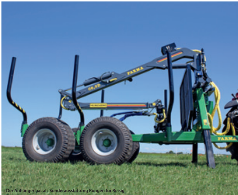
Der Anhänger hat als Sonderausstattung Rungen für Reisig