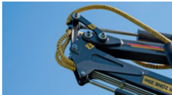
Der Kran hat ein Kniegelenk zwischen Hauptarm und Ausleger, dadurch erlangt er eine bessere Arbeitsgeometrie, wird stärker und erlangt einen geschmeidigeren Bewegungsablauf.